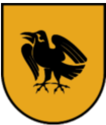
Ramsau im Zillertal