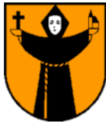
Zell am Ziller