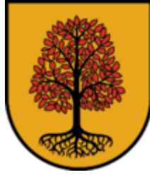
Buch bei Jenbach