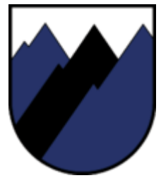
Steinberg am Rofan