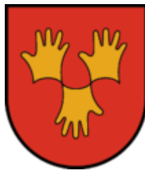
Ried im Zillertal