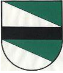
Bruck am Ziller