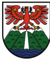
St. Anton am Arlberg