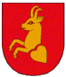
Pettneu am Arlberg